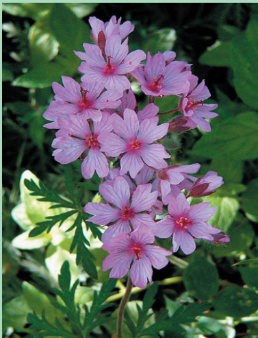
Το άγριο γεράνι (ζιντράβετς) κυρίαρχο φυτό του εορτασμού

Οι γυναίκες πολύ πρωί πηγαίνανε στον υπαίθριο χώρο όπου θα γιόρταζαν, ανάβανε φωτιά και βάζανε το καλαμπόκι που είχαν μουλιάσει από βραδύς, για να ξεκινήσουν το φαγητό με σπόρο ψωμιού και το υπόλοιπο το μοιράζανε στους διερχόμενους για το καλό της σοδειάς. Όσοι ήταν άρρωστοι, πολύ πρωί πριν ανατείλει ο ήλιος, τριβανε ένα σχοινί από τρίχα κατσίκας σε ξερό ξύλο, για να πιάσουν ζωντανή φωτιά [Jiv Ogan ], να την διαπεράσουν μέχρι επτά φορές για να βρουν την υγεία τους. Κατά την διάρκεια της ημέρας τα κορίτσια και τα αγόρια στήνουν κούνιες με πλατιά σανίδια και ανεβαίνουν δύο, τρεις κοπέλες μαζί. Τα αγόρια τις κουνούσαν δυνατά, και άμα κάποια κοπέλα δεν ήθελε το αγόρι που την κουνούσε κατέβαινε από την κούνια που σήμαινε ευγενικά, ότι δεν τον θέλει για μέλλοντα σύζυγο. Τα αγόρια λέγανε ανάλογα τραγούδια χαράς ή απογοήτευσης κατά περίπτωση προκειμένου να εκδηλώσουν τα αισθήματά τους προς τις αγαπημένες τους. Τα κορίτσια επίσης την ημέρα εκείνη βγάζανε όλα τα μάλλινα προικιά τους κατά πρώτο λόγο να λιαστούνε και μην τα τρώει ο σκόρος και κατά δεύτερο λόγο να παρουσιάσουν την προίκα τους και ότι είναι έτοιμες