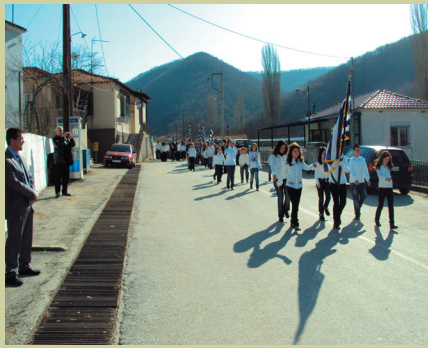
Οργάνη: Παρέλαση 25ης Μαρτίου 2011