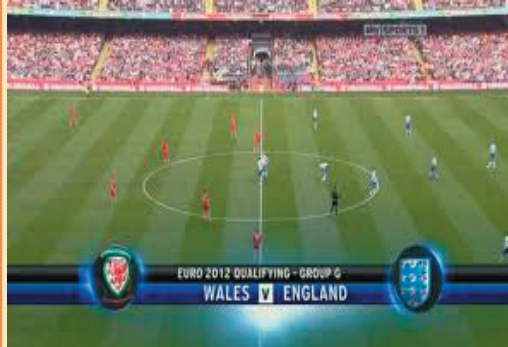
Η έναρξη της ποδοσφαιρικής αναμέτρησης

Είχαμε αναφέρει στο φύλλο της Ζαγάλιστα αριθ. 49 ότι μία τιτάνια προσπάθεια βρίσκεται σε εξέλιξη στην Ουαλία, προκειμένου να διασωθούν τα Ουαλικά και να τα διδαχθούν και οι νέες γενιές που πλέον έχουν Αγγλοφωνήσει ολοκληρωτικά. Οι προσπάθειες άρχισαν να αποδίδουν καρπούς.