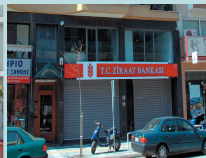
Ξάνθη: επέτειος 25ης Μαρτίου 2011. Χωρίς Ελληνική σημαία!