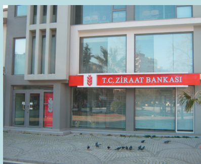
Κομοτηνή: επέτειος 25ης Μαρτίου 2011. Χωρίς Ελληνική σημαία!