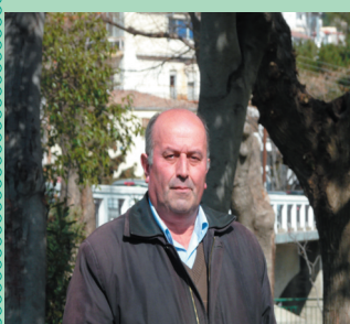
Άρθρο του Ιμάμ Αχμέτ

Μέχρι σήμερα έχουν διατυπωθεί πάρα πολλές εκδοχές σχετικά με το Εντρελέζ είτε από την πλευρά των Τούρκων είτε από την πλευρά των Βουλγάρων.