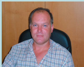
Άρθρο του Κεμάλ Φαρζλή

Πρόκληση πέρα από κάθε όριο θεωρείται η μη ανάρτηση της ελληνικής σημαίας στις εθνικές και τοπικές επετείους, από τα δύο (2) υποκαταστήματα της τουρκικής Τράπεζας ZİRAAT BANKASI A.Ş. στην Κομοτηνή και την Ξάνθη.