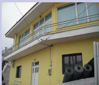
Το καινούργιο κτήριο της Τουρκο-βιβλιοθήκης Κενταύρου

Αναρωτιόμαστε: μεγαλοσχήμονα στελέχη της σημερινής κυβέρνησης, όπως ο Ξανθιώτης υπουργός κ. Σωκράτης Ξυνίδης , πάτησαν ποτέ το πόδι τους, στην βιβλιοθήκη, ώστε να διαπιστώσουν ιδίους όμμασι και να αξιολογήσουν το παραγόμενο έργο; Ποιοι θα κρίνουν τι πραγματικά συμβαίνει; Άνθρωποι που ούτε το κτήριο, όπου στεγάζεται, δεν γνωρίζουν;