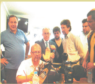
Στιγμιότυπο από την ... επιτροπή λογοκρισίας!

Διάφοροι τύποι έλεγαν ότι ανήκουν σε αρμόδιες υπηρεσίες αλλά κανείς δεν μας εξηγούσε την ιδιότητά του ή δεν μας έδειχνε κάποιο έγγραφο, όπως ταυτότητα κλπ. Τους είπαμε ότι εάν κάναμε κάτι παράνομο, αρμόδια για να το κρίνει είναι η ελληνική δικαιοσύνη και ζητήσαμε να καταφύγουμε σε αυτήν, αλλά κανείς δεν αντιμετώπιζε με αυτή τη λογική το γεγονός...και εμείς ζούμε στη Γαλλία,