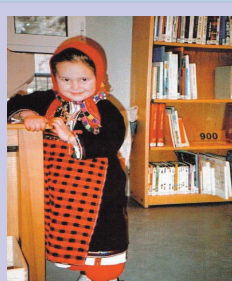
Πομακοπούλα, με παραδοσιακή φορεσιά, μέσα στη βιβλιοθήκη της Μύκης

Το κόστος ανοικοδόμησής είναι τεράστιο για τα δεδομένα του χωριού. Πού άραγε βρέθηκαν τα χρήματα;