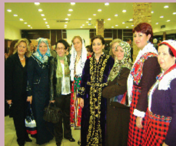
Στη μέση, η σύζυγος του Τούρκου προξένου με τουρκική ενδυμασία και τρεις γυναίκες με Πομάκικες φορεσιές

Υποψήφιοι περιφερειάρχες, δήμαρχοι, σύμβουλοι και ό,τι άλλο βάζει ο νους του ανθρώπου. Χαμόγελα, σκύψιμο της μέσης, κοινότοπες έως βλακώδεις φιλοφρονήσεις και ...θερμές χειραγίες περιελάμβανε το ανατολίτικο μενού , το οποίο ετίμησαν σύσσωμοι οι συνεορτάζοντες την ίδρυση της τουρκικής δημοκρατίας, ελληνόφωνοι χριστιανοί υποψήφιοι!