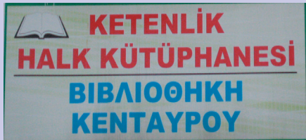
Πινακίδα της Τουρκο-βιβλιοθήκης του Κενταύρου

Η βιβλιοθήκη έλκει τον μαθητή και δημιουργεί μια ξεχωριστή ατμόσφαιρα πολυτέλειας, αλλά και συνθήκες (τουρκικής) μάθησης πρωτόγνωρης για την ορεινή περιοχή. Εκτός, από αυτήν λειτουργεί και η βιβλιοθήκη του Εχίνου , η ιδεολογία της οποίας απεικονίζεται στην επιγραφή της. Αν και είναι δημοτική βιβλιοθήκη, φέρει τον τίτλο της και στα ... τουρκικά! (βλ. φωτο)