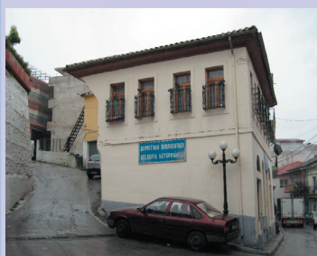
Η βιβλιοθήκη του Εχίνου

Φυσικά, την ίδια στιγμή, θλιβερά μπουλουίκια χριστιανών υποψηφίων παντός πολιτικού χρώματος, περιφέρονται από Πομακο-χωρίου εις Πομακο-χωρίον, περιβεβλημένοι με βλακώδη χαμόγελα και εμετική διαχυτικότητα, χωρίς να τους καίγεται καρφί για την ορεινή Ροδόπη, την οποία παραδίδουν αμαχητί στην σφαίρα πολιτικής και πολιτισμικής επιρροής της Αγκυρας.