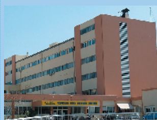
Το Σισμανόγλειο νοσοκομείο Κομοτηνής

Κατά τα άλλα, στις 26 Σεπτεμβρίου 2010, γιορτάστηκε η Ευρωπαϊκή Ημέρα Γλωσσών ....Ο εορτασμός του χρόνου θα πρέπει να έχει επίκεντρο τα Πομακοχώρια και την Πομακική γλώσσα!