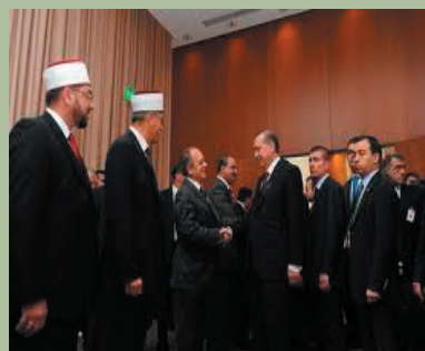
Ο δύο Ψευτομουφτήδες αναμένουν στην ουρά τον Τούρκο πρωθυπουργό...

Εκεί έχουμε καταντήσει, να λέει ο Τούρκος πρωθυπουργός όσα θα έπρεπε να λένε οι ανύπαρκτοι Έλληνες πρωθυπουργοί των τελευταίων δεκαετιών.