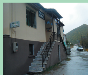
Αντί σημαίας...χάρτινα σημαίακια

Πότε θα ξανακομμάτισε η Ελληνική σημαία στην κοινότητα Οργάνης;