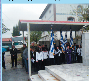
Υπό βροχή στο υπόστεγο του Ηρώου

Ο εορτασμός της εθνικής επετείου της 28ης Οκτωβρίου 1940, αν και ο πιο σύντομος των τελευταίων ετών, γέμισε με χαρά τους Πομάκους της Οργάνης . Αψηφώντας το κρύο και το φιλόβροχο, τα μικρά παιδιά των δημόσιων σχολείων της