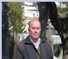
Άρθρο του Ιμάμ Αχμέτ

Προκειμένου να εκλεγούν περιφερειάρχες ή δήμαρχοι, θυσιάζουν ό,τι ιερό και όσιο υπάρχει. Τα δήθεν ελληνικά κόμματα, συμπεριέλαβαν στους συνδυασμούς τους αυτούς που είναι αρεστοί στην Άγκυρα. Τον ...Φετρά (ιερονομική ρήτρα) ή αλλιώς την «υποψηφιότητα», θα την λάβουν από τον Ψευτομουφτή Ξάνθης, Α. Μετέ . Δια του λόγου το αληθές, δέστε τις εφημερίδες Γκιουνδέμ και Μιλλέτ, της 14ης και 15ης Οκτωβρίου 2010 (στις σελίδες 5 και 6 αντίστοιχα), όπου εμφανίζονται οι υποψήφιοι σύμβουλοι του υπ. Περιφερειάρχη κ. Γ. Παυλίδη (Ν.Δ.) μαζί με τον παράνομο Ψευτομουφτή Ξάνθης. Το ίδιο γίνεται και με τους υποψηφίους του κ. Αρη Γιαννακίδη (ΠΑΣΟΚ).