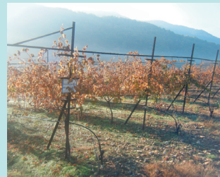
Αμπελώνας στην περιοχή Οργάνης

Τα τρία τελευταία χρόνια κάτι αλλάζει στις καλλιέργειες της Οργάνης .