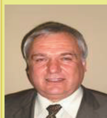
Χαλίτ Μεμέτ, Δήμαρχος Αρριανών