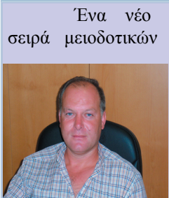
Άρθρο του Κεμάλ Φαρζλί

Ένα νέο χτύπημα -από μία σειρά μειοδοτικών ενεργειών- δέχονται τα Πομακοχώρια, τη στιγμή που η εκτουρκιστική παρούσα της Άγκυρας διογκώνεται ποσοτικά και ποιοτικά. Αναφερόμαστε στη μοναδική Ελληνική (Ελληνόφωνη) βιβλιοθήκη των Πομακοχωριών της Ξάνθης και της Ροδόπης, η οποία λειτουργεί στο χωριό Μύκη από το 2004, με 7.000 βιβλία.