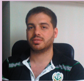
Άρθρο του φοιτητή Χασάν Κάλφα

Αυτό που σίγουρα πρέπει να γίνει είναι οι Πομάκοι να δυναμώσουμε και να ενισχύσουμε την πιο ισχυρή οργάνωση που διαθέτουμε σήμερα στην Ελλάδα, τον Πανελλήνιο Σύλλογο Πομάκων.