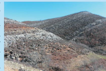
Υψώματα Τσόρκα - Τσούκα

Αναλυτικά τα ονόματα που καταγράψαμε μαζί με τις φωτογραφίες μπορείτε να τα βρείτε στο διαδίκτυο στην ιστοσελίδα της Ζαγάλιστα ( www.zagalisa.gr ).