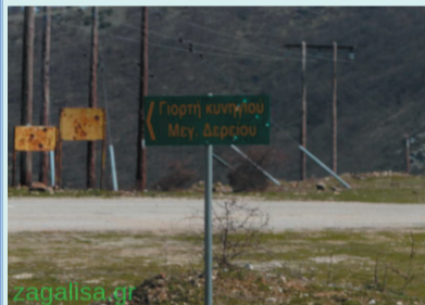
Η πινακίδα ακόμη δείχνει το δρόμο...

Άλλη μια αισχρή απόφαση στο χώρο της Ελληνικής Θράκης, προκαλεί προβληματισμό, αλλά και αγανάκτηση. Φέτος, η Γιορτή Κυνηγιού, που γινόταν με τεράστια επιτυχία, τα δύο τελευταία χρόνια στο Μέγα Δέρειο, θα μεταφερθεί στον ...ποταμό Άρδα, στον βόρειο Έβρο!