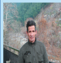
Άρθρο του Κανδουχάρ Σουκρή

Οι Πομάκοι είμαστε ένας λαός που έζησε επί χιλιάδες χρόνια στα βουνά της Ροδόπης. Με τον καιρό δώσαμε Πομακικά ονόματα στα βουνά, στα ποτάμια, στις κορυφές.