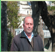
Άρθρο του Ισμά Αχμέτ

Κατά το έτος 1968, με Βασιλικό Διάταγμα, που εξέδωσε η τότε στρατιωτική